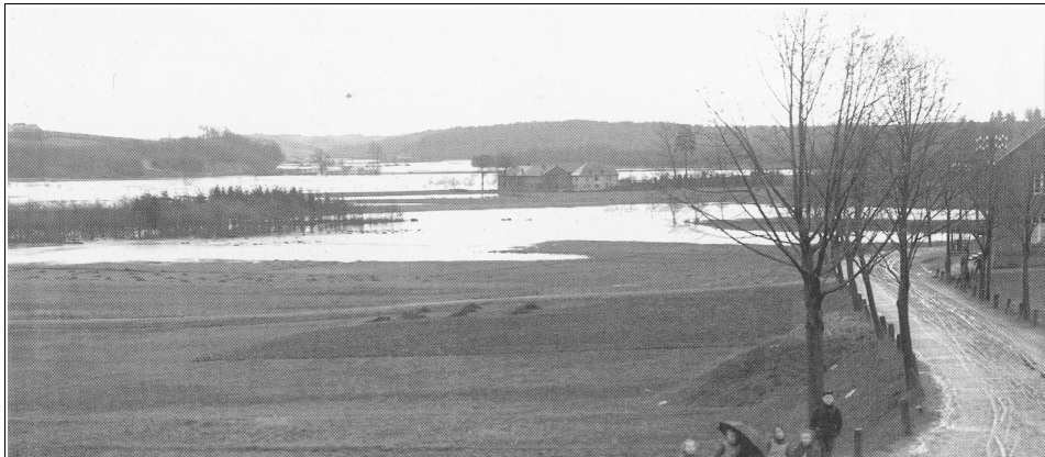
1909 breitet sich um den Pannhof ein großer See bis nach Menzlingen und Rambrücken aus. Früher hatte die Sülz Platz – heute ist fast alles bebaut. Die Schäden für Bürger und Stadt können gigantisch werden.

Die SPD-Fraktion hat sich bis auf Ratsmitglied Bachmann einhellig für die Einstellung des Verfahrens ausgesprochen. Fraktionsvorsitzender Dirk Mau: „Die neuen Erkenntnisse bezüglich der Überschwemmungsgebiete zu ignorieren würde bedeuten, wider besseren Wissens zu handeln. Dies wäre grob fahrlässig und nicht zu verantworten.“ Auch die Grünen-Fraktion machte deutlich, dass sie aufgrund der Gutachten für die Einstellung des Verfahrens ist, überließ aber den Partnern in der Kooperation (CDU und FDP) ihre Entscheidung.