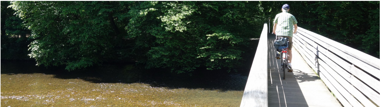
Brücke bei Donrath

Zum Startpunkt Bahnhof Overath kann man mit der RB25 fahren: Abfahrt in Rösrath 10:14 Uhr; Ankunft Overath 10:28 (Personenticket und Ticket fürs Rad lösen!). Die Strecke führt weitgehend abseits der Hauptstraßen durch die Auenlandschaft von Agger und Sülz, durch Waldgebiete und entlang einer historischen Bahnstrecke (von Lohmar nach Siegburg). Sie werden ein attraktives Landschaftserlebnis mit vielen wenig bekannten Strecken genießen können. Kritische Punkte der Route sind einige innerörtliche Passagen und schmale Holzbrücken, die nur in einer Richtung befahren werden können – bei Unsicherheit lieber absteigen.